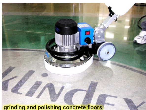
grinding and polishing concrete floors