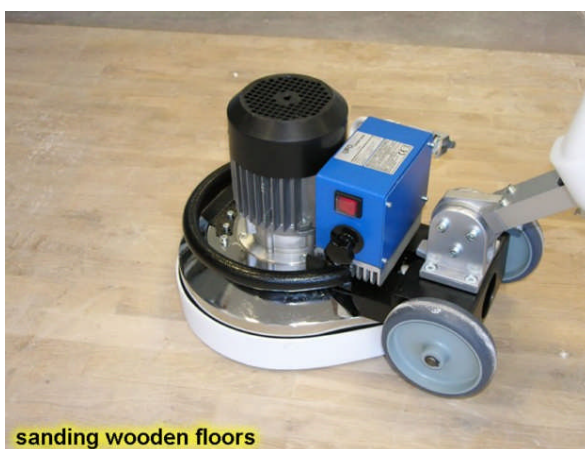
sanding wooden floors