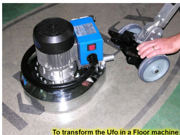
To transform the Ufo in a Floor machine